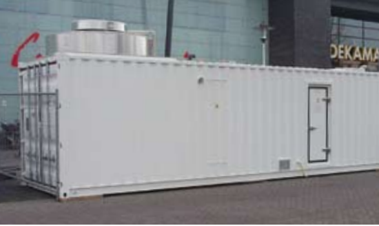
Foto van de mobiele bioreactor (TCE concept) en van een gedeelte van de binnenkant van de container met buffer, filter en doseervat.